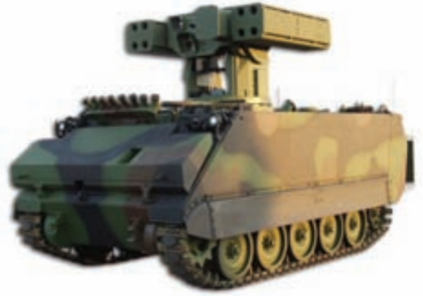
Resim 4. KMS: Stinger Füzeleri için Aselsan tarafından tasarlanan ve üretilen, herhangi bir kara veya deniz savaş platformunun kaidesine monte edilebilen Laser Mesafe Bulma cihazı Türk Silahlı Kuvvetleri tarafından kullanılıyor.

üzerinde kalacak şekilde hareket ettirebilirsiniz. Bu da yoğun trafik içerisinde hareket eden bir arabayı kilometrelerce öteden hedefi hiç görmeden atılmış bir füzeyle, hedefi gören bir yerden laser aracılığıyla yönlendirerek vurabileceğiniz anlamına gelir. Bu tür füzelere Laser Güdümlü Bomba (LGB) adını veriyoruz. ASELSAN'ın Türk Silahlı Kuvvetleri için 90'lerden bu yana tasarlayıp ürettiği sistemler kilometrelerce mesafeden hedef işaretlemesini sağlamakta. Olağanüstü yüksek isabet gücü veren laser teknolojisi, sağlayacağı üstünlük nedeniyle kritik bir teknoloji olarak değerlendirilmektedir. Bu teknolojiye sahip az sayıda ülke, bu becerinin yayılmasını doğal olarak engellemeye çalışıyor.