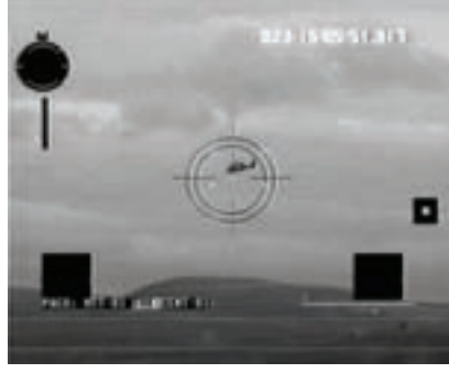
Resim 3. Bir termal kamera ile birleştirildiğinde laserli mesafe ölçme ve hedef işaretleme sistemleri savaş alanında büyük bir üstünlük sağlıyor.

Şimdi bu harmanın kuantum kısmına dönerek, "uyarılmış yayınlama" olayını şöyle açıklarız: Kendi halinde mutlu mutlu varlığını sürdüren bir atoma (ya da moleküle) bir şekilde enerji verirsek, çekirdeğin en dışında bulunan elektron atomdan bir miktar uzaklaşır. Bu durumda elektron ve çekirdek arasında potansiyel enerji depolanmış olur. Ne var ki bu uzaklaşma ve depolanan enerji rast gele bir değerde olmaz. Bir merdivenin basamakları gibi belirli aralıklarla artabilir. (Kuantum dünyasındayız ve sürekli değil aralıklı değerler görüyoruz). Bu enerji depolanmış elektron-atom çiftine "uyarılmış" adını veriyoruz. Şimdi gelelim "yayınlama" kısmına... Diyelim şans eseri bir foton bu uyarılmış elektron-atom çiftine çarpıyor. Eğer bu fotonun enerjisi depolanmış enerjiden farklıysa foton, ışığın pencere camından geçişi gibi, hiçbir şey olmamış gibi yoluna devam ediyor. Ama fotonun enerjisi depolanmış enerjiye eşitse, elektron-atom çifti depolanmış olan enerjiyi gelen fotonla tamamen aynı özelliklerde başka bir foton olarak dışarıya yayınlıyor. Bu durumda elimizde birbirin aynısı iki foton oluyor. Eğer bu iki foton uyarılmış iki elektron-atom çifti üzerine düşerse aynı özellikte iki ilave foton daha oluş-