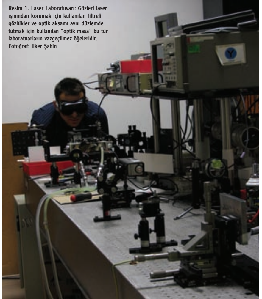
Resim 1. Laser Laboratuvarı: Gözleri laser ışınından korumak için kullanılan filtrelili gözlükler ve optik aksamı aynı düzlemde tutmak için kullanılan “optik masa” bu tür laboratuvarların vazgeçilmez öğeleridir.

Laserlerin ordular için önemini anlamak için bir şöyle senaryo düşünelim: Düşman askerleri, cephanelerinin yerini bir grup bina arasında sürekli değiştiriyorlar. Bu çok sağlam binalardan birini imha edebilmek için büyük bir bomba kullanmanız gerekmektedir. Bu bombayı atabilecek olan sisteminizi (uçak, tank, ya da herhangi bir başka platformu) hedefe en fazla 10 kilometre yaklaştırabilmektesiniz. Daha fazla yaklaşırsanız kendi askerlerinizin güvenliği tehlikeye düşecek. Ayrıca bu büyük bombalardan her birinin ülkenize maliyeti birkaç yüz bin YTL. Tüm bunlara ek olarak imha etmeyi planladığınız binalar, sivil binaların