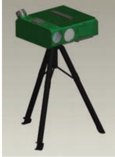
Resim 5. Engerek: Özel Kuvvetler için tasarlanan bu yeni nesil mesafe bulma, koordinat belirleme ve hedef işaretleme sistemi benzer cihazlar arasında dünyada en ileri noktada bulunuyor.

Türkiye'nin imzaladığı bir diğer uluslararası sözleşme de Wassenaar Düzenlemesi'dir. Bu düzenleme uyarınca, imzası bulunan ülkeler, laserleri